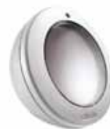
Sensor sol Sunis RTS

El sistema con brazo de punto recto conlleva el abatimiento frontal de los brazos del toldo con total independencia de los soportes superiores del tubo de enrollado de la lona. Es un sistema tradicional con los brazos colocados en una posición superior y el brazo tiene la tensión suficiente para resistir al viento.