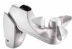
Sensor sol y viento inalámbrico RTS

El sistema Solaris S1 de brazo store es un toldo con fijación a barandal y a suelo, muy sencillo de accionar, práctico y económico. Consigue un efecto cortina ideal al poder colocarse en posición totalmente vertical.